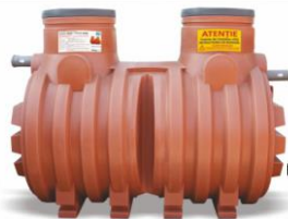
NG 10 / NG 15