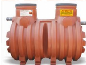
NS 6 / NS 10