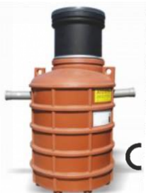
NG 2 / NG 4